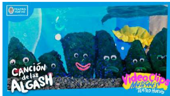
Videoclips: Canción de las Algash

Teatro Huevo también se puede escuchar y ver: hemos publicado varios videoclips musicales en Youtube y nuestra página web: teatrohuevo.com .