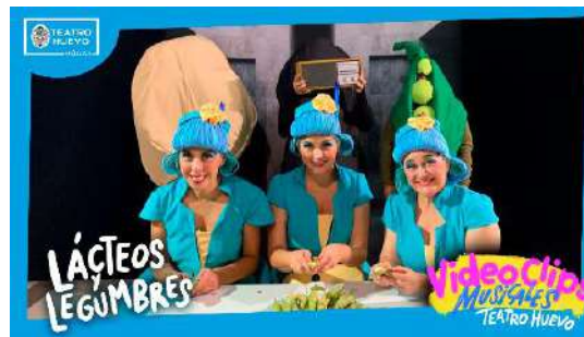
Videoclips: Lácteos y Legumbres