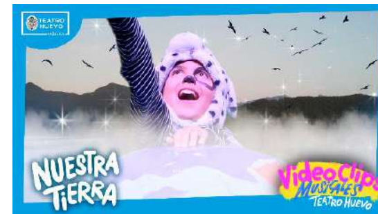
Videoclips: Nuestra Tierra