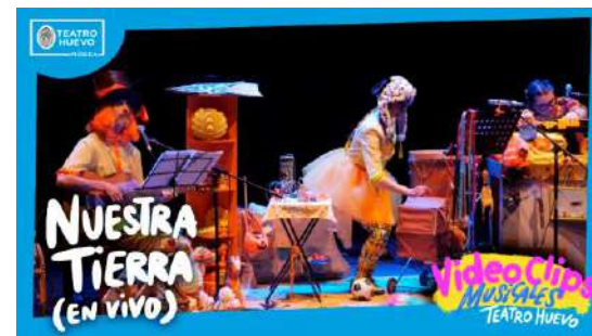
Videoclips: Nuestra Tierra (en vivo)