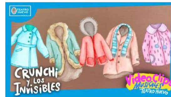
Videoclips: Crunchi y los invisibles