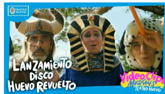
Videoclips: Lanzamiento del disco