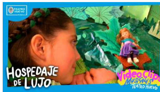
Videoclips: Hospedaje de Lujo