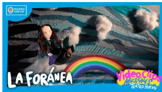
Videoclips: La Foránea