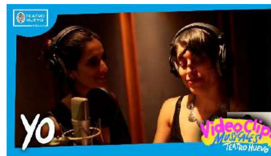
Videoclips: Yo (versión acústica)